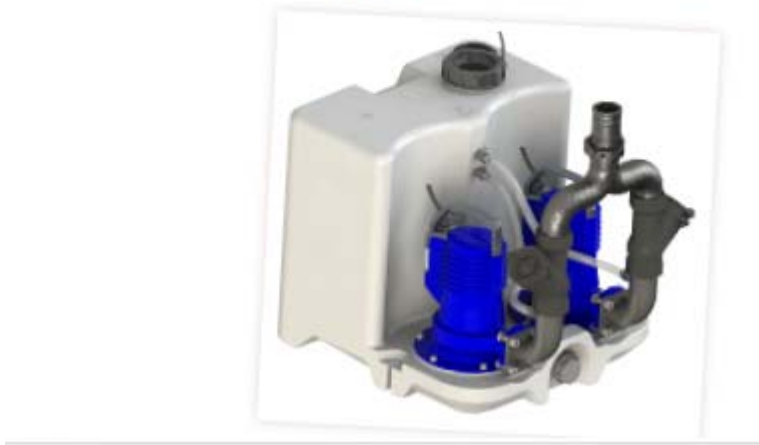
BoxDuplex S 油水分离器

新版油水分离器 BoxDuplex S 系列是泽尼特基于油水行业多年的经验积累的基础上，针对中国餐饮，专为“高含油量”、“大处理量”、“高含固量”等餐饮场合而开发的一款油水分离器。