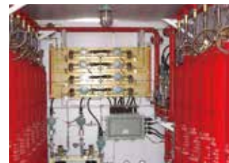
平台用二氧化碳灭火装置