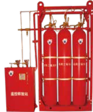
船用二氧化碳灭火装置