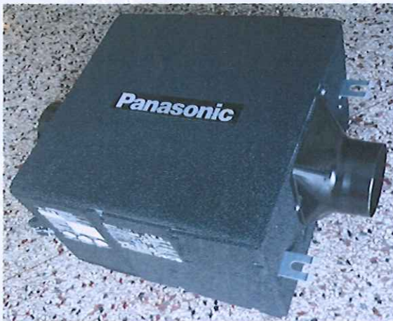
图 2 机组外观