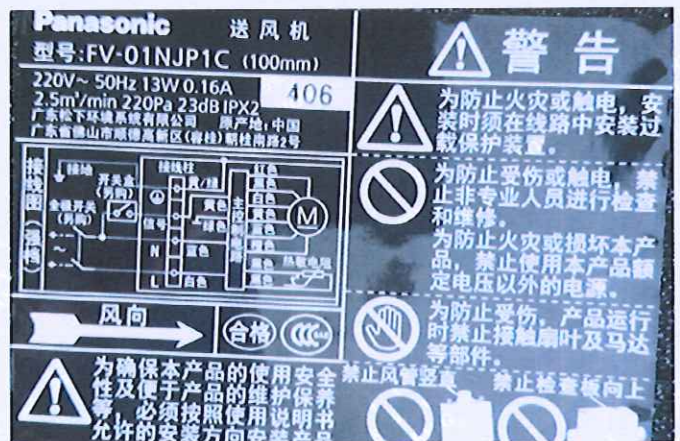
图 3 机组铭牌