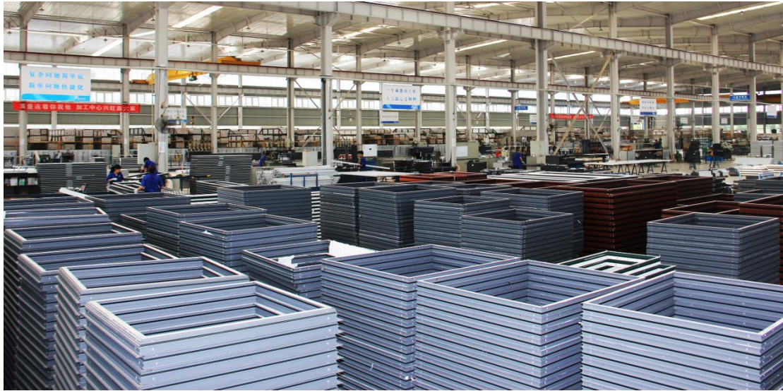
系统门窗加工车间