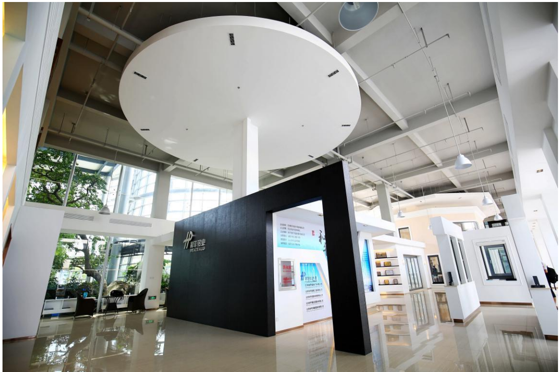
和平门窗系统产品展示大厅