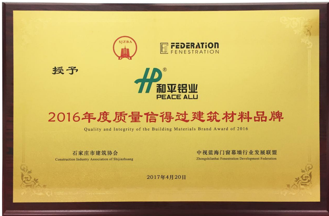
质量信得过建筑材料品牌