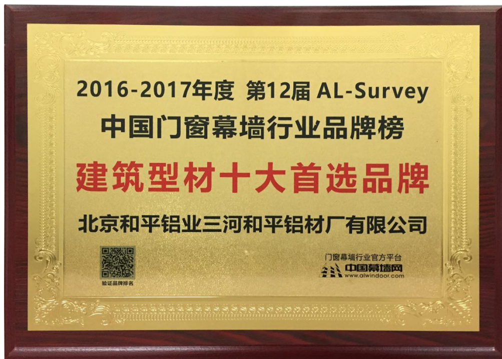
建筑型材十大首选品牌