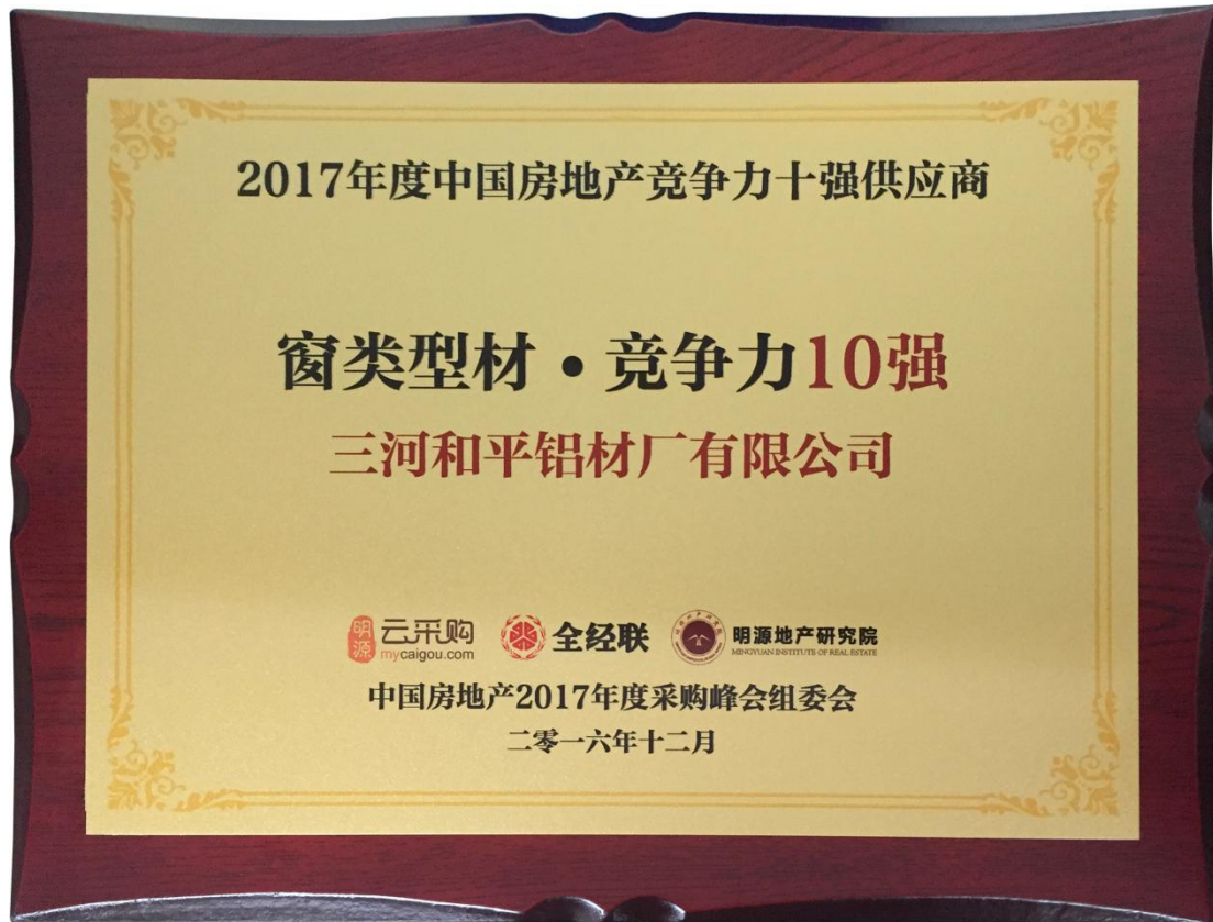
中国房地产竞争力十强供应商—窗类型材