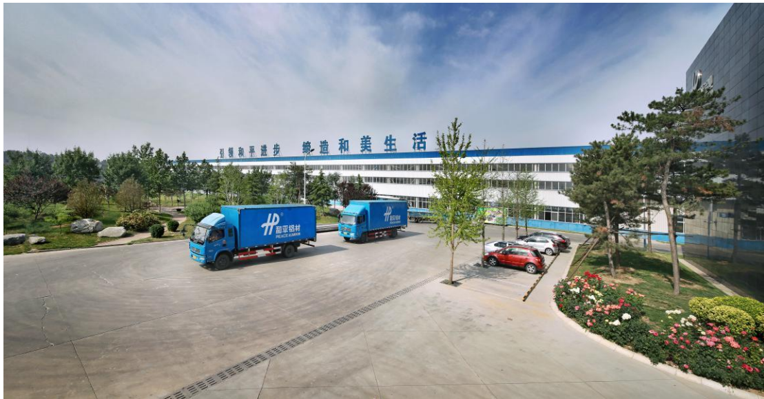
和平铝业花园式工厂