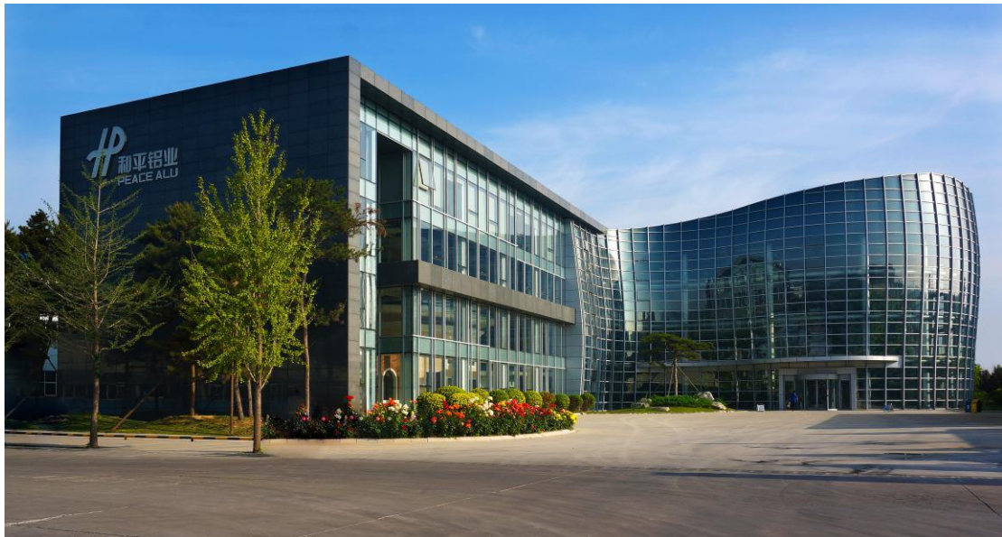
和平铝业总部双曲玻璃幕墙办公大楼