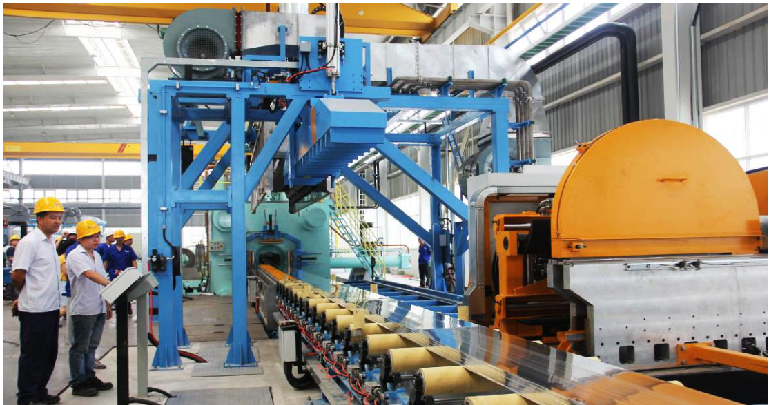
7500 吨挤压机，用于生产超大幕墙和工业型材