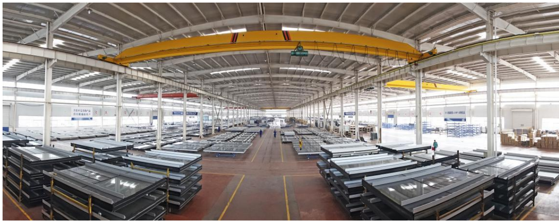
单元体幕墙加工车间