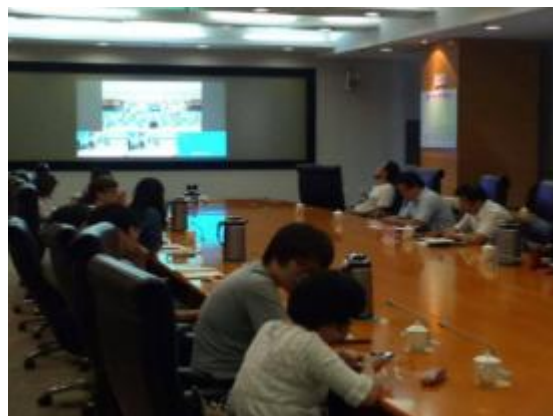
天津卫生局与各大医院组会