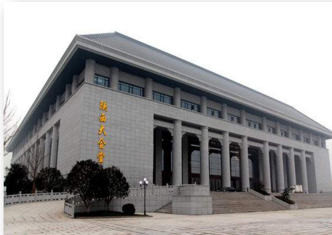
陕西大会堂+18号楼宾馆-2012年 陕西省重点项目