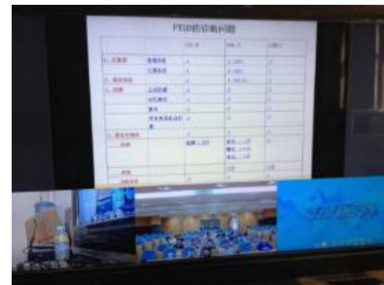
视频会议中的辅流传输