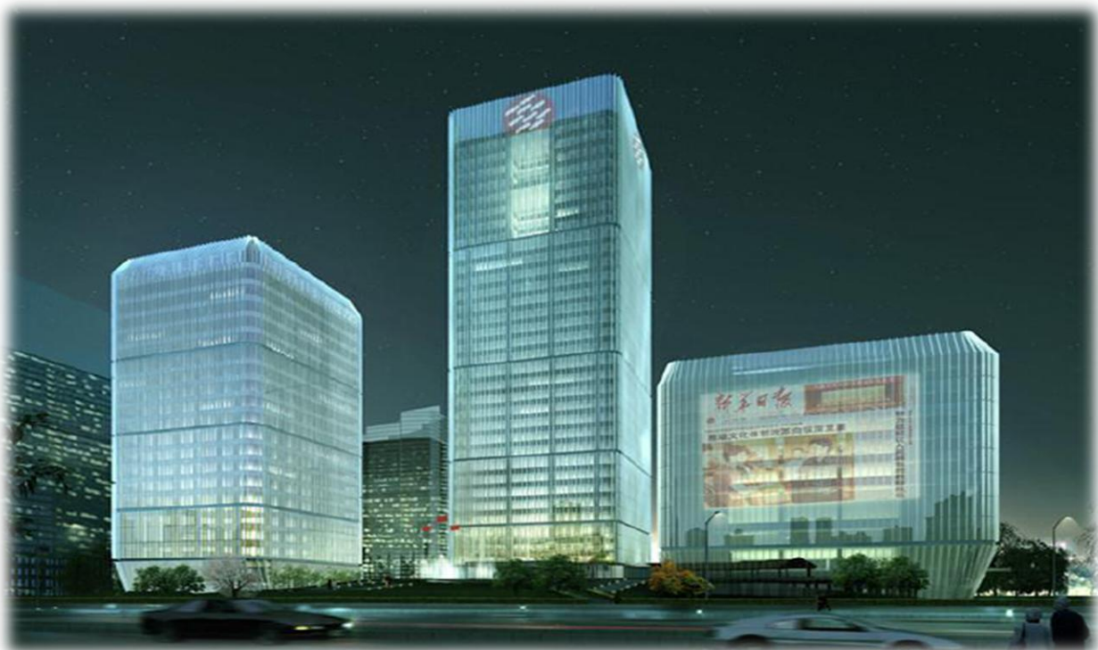
新华日报集团大厦