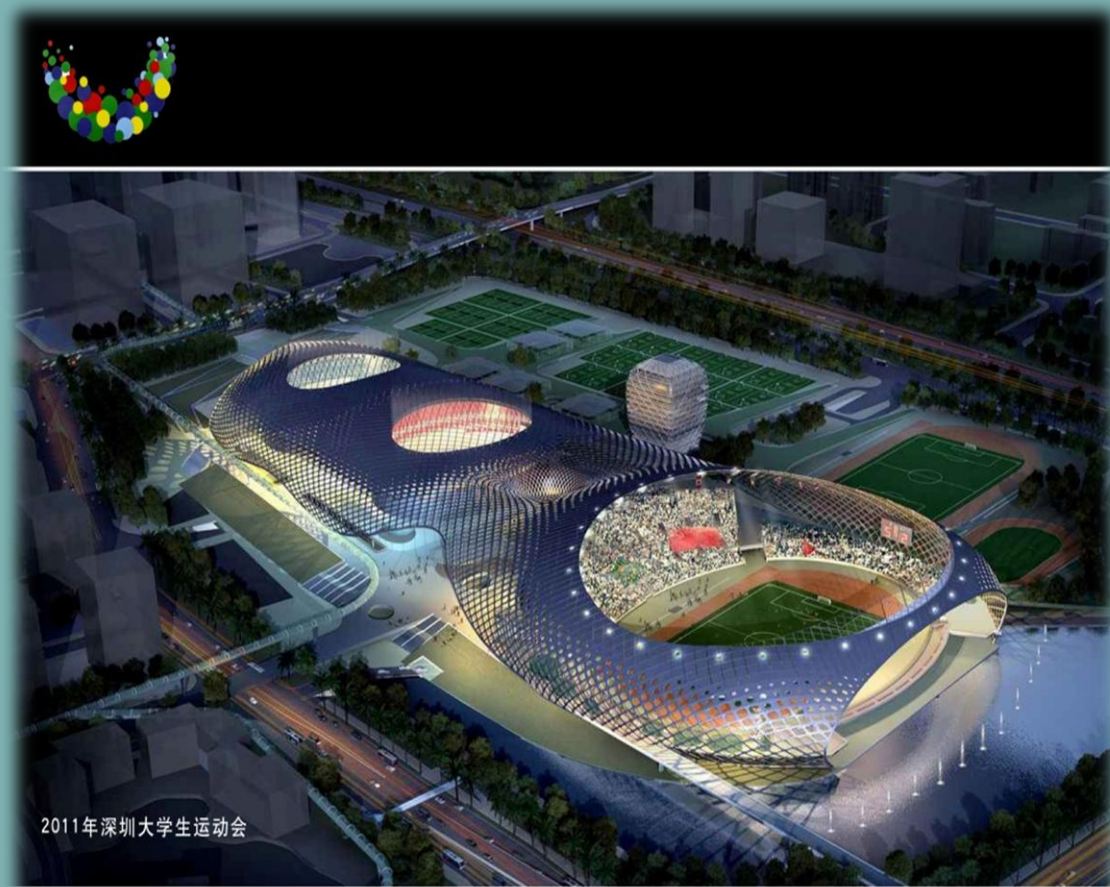
2011年深圳大学生运动会