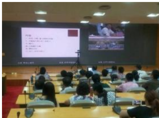
天津泰心医院参与视频会议