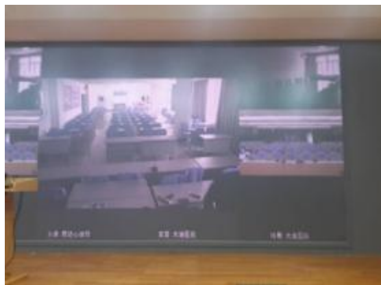
天津大港医院参与视频会议