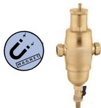
Product group 83