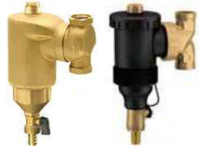
Product group 83