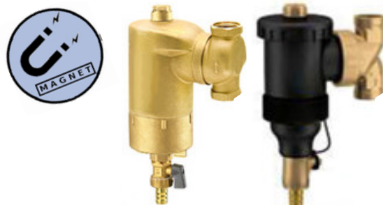
Product group 83