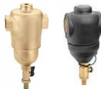
Product group 83