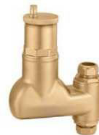
Product group 84